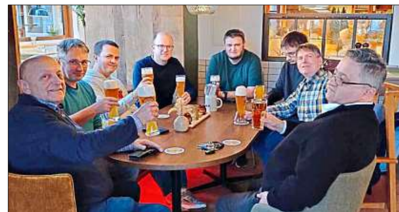
Ortenburgs Schachspieler stoßen auf den Titel an.

In der nun abgelaufenen Spielzeit 2025/2026 der Bezirksliga Ost gewann Ortenburg alle sechs Mannschaftskämpfe, die meisten davon deutlich. Von fast 50 ge-